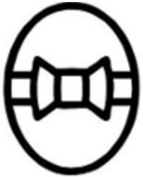
ŒUF DE PÂQUES

Assemble les deux moitiés afin de reformer les pictogrammes suivants : (ne fonctionne pas en diaporama)